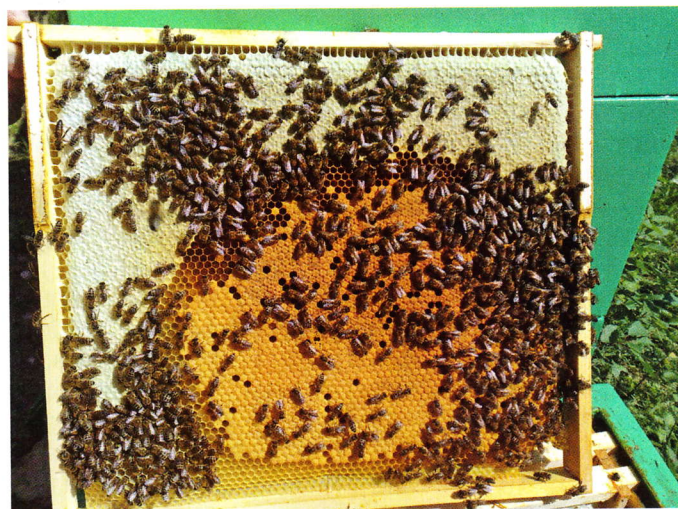
Krásně zakladený plást se zásobami