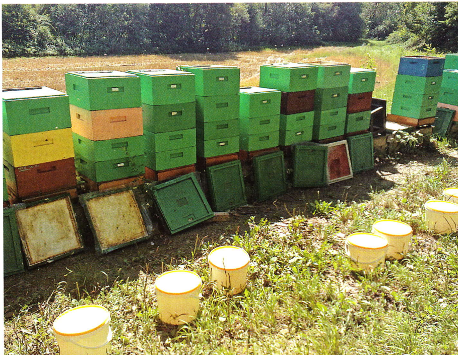
Vylepšené úly na včelnici

V mém včelařském provozu jsem ze začátku také používal (a ještě dosluhují) tenkostěnné čtvercové dřevěné nástavky na 11 rámků s možností teplé i studené stavby. Rozhodně jsem však přeskočil světový „česko-slovensko-polský“ unikát palubkových úlů (neparafinovatelných, s polystyrenem uprostřed, neekologických, těžkých a neohrabaných, bez řádných úchopů, širokých atd.). Prvně jsem se uchýlil k „zateplení“ pomocí kočovních včelařských vozů, včelínů apod. Rozdíl byl znát. A také jsem se poohlédl po Evropě. Výsledek byl zcela jasný: všude se pomalu začínají šířit plastové stě-