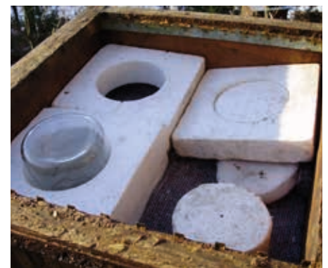
Napájení zateplenou sklenicí dle přítele Bajera z Velkého Beranova

upevníme. Takové včelstvo patří do igelitového pytle, usmrtit mrazem (postačí ponechat venku) a do vařáku (samozřejmě bez včel). Vosku z takových včelstev nic není – rámečky ale doporučuji po vyvaření spálit nebo dezinfikovat máčením v louhu sodném nebo parafínu nebo ošetřit Bee-Safem. Pokud nalezneme plod v horším než obvyklém stavu – propadlá a proděravělá víčka či zahnívajících, podezřele vypadající plod, ihned voláme veterináře a předáváme podezřelý plást k vyšetření! Na zesláblá včelstva se bohužel dívá jinak včelař se 4 včelstvy než včelař se 30 včelstvy. Ten první se mnohdy snaží zachránit, co jde, opečovává, komorovat, překládat do plastových plemenáčů apod. Ano, má to význam a v opodstatněných případech bych to doporučil použít, ale v první řadě bych se snažil přijít na to: Proč se to stalo? Byla to varroáza, stará nevyměněná matka, vyrojené včelstvo nebo pozdní oddělek? Měl