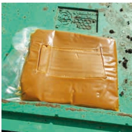
Těsto Feed Bee připravené k položení a zamačkání na horní loučky

Zhruba měsíc po budící prohlídce, tedy asi koncem března, můžeme většinou přistoupit k třetí prohlídce P3, tj. k rozšiřovací prohlídce. Kdy přesně? Až včelstva mají plod na 6 až 7 plástech. To samozřejmě u mnohých z nás a v mnohých letech nastává až v dubnu. Souhlasím a odkazuji na opětovně přečtení Návodu pro použití Kalendária, jenž vyšel v únorovém Včelařství.