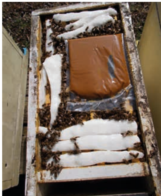
Vyzimovaný plemenáč většinou potřebuje jak Feed Bee, tak více těsta Apifondy