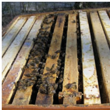
Kdo má odvalu, tak do přidávaného nástavku souší může také přemístit tři plodové rámký

Po prvních prohlídkách bychom se měli zabývat kontrolou zdravotního stavu včelstev. Většinou již touto dobou máme výsledky vyšetření na varroázu. V tuto chvíli se musíme řídit nařízením příslušné veterinární správy, která zpravidla nařídí těm včelařům, u nichž byl průměrný počet roztočů na včelstvo vyšší než 3 kusy (někdy i jen 2) nátěr plodu léčivem s následnou fumigací. Léčivo zajišťuje místní ZO ČSV. Nátěr plodu má tu výhodu, že léčivo proniká i skrz víčka buněk a ničí tak roztoče ukryté v zavíčkováném plodu. Nátěr je třeba provést do daného termínu a do určité maximální rozlohy plodu. Výsledek přes 3 roztoče je většinou důsledkem naší léčebné nekázně v celém minulém roce. Měli byste zbystrit, i pokud se váš počet roztočů přibližuje 3 kusům, a alespoň si již pro krásné plné jaro opatřit např. Formidol, či si připravit více stavebních rámků a boj s varroázou začít koncem dubna. Je všeobecně známo, že trubčí plod je pro roztoče velikým lákadlem a vyřezáváním zavíčkováné trubčiny (zejména tedy té pozdní