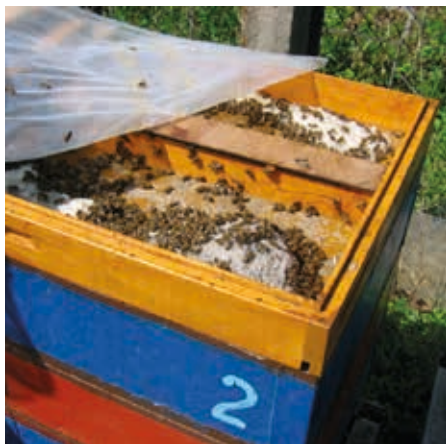
Dříve jsem dával medocukrové těsto do krmítka

V posledních letech teplejších zim se totiž březen stal povětšinou obdobím, kdy začínají kvést první byliny a snad každý včelař