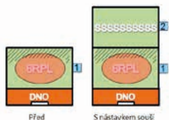
U vyzimovaného jednonástavkového včelstva

Pokud mám dostatek souší, tak rozšířím o jeden nástavek souší nahoru. Zde podotýkám, že souše jsou pro včelaře to pravé jarní „zlato“, a kdo chce vysoké medné