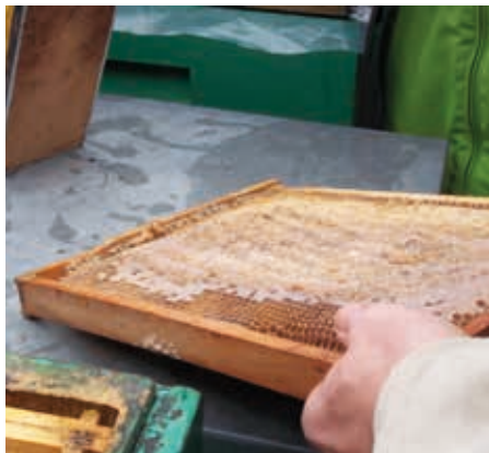
Poškrábaný rámeček vložíme těsně k plodu

bych si říci: Tak to bylo naposledy! Příště budu důslednější! Opravdu nehedejme med v chovu velkého množství včelstev, ale v silných zdravých včelstvech. Takže ideální je začít teď hned, ozřejmit příčiny (z 90 % vlastní chyby) a slabá včelstva spojit, zrušit a nezabývat se zachraňováním.