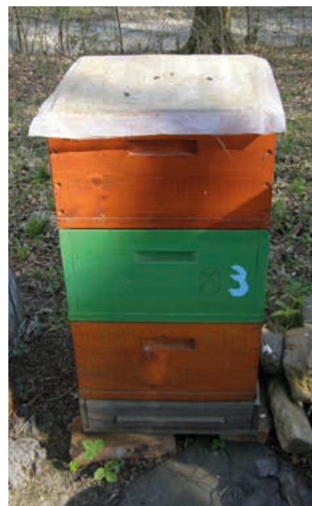
Včelstvo po rozšíření o nástavek souší

Aplikace: používám dřevěné rámy pod víka úlů (nebo prázdné nástavky), jež mi zvýší podvíkový (poduteplivkový) prostor na cca 20 mm, a tam vložíme placku. Samozřejmě přikryji igelítem.