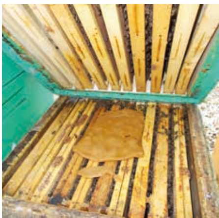
Feed Bee placca vložená mezi nástavky

již nahlédne do svých včel. Ti, kteří chtějí se včelami hospodařit pořádně = intenzivně, již mají za sebou první větší zásahy a změny ve včelstvech, jak jsem popisoval v únorovém kalendáriu. Není se toho třeba bát. Tedy pokud chováte silná včelstva a dáváte dostatek zimních zásob. U slabších včelstev a oddělků (tj. do síly 4 zimujících uliček r. m. 39 x 24) jenom kontroluji, aby včely seděly v dosahu zásob a měly jich dostatek. S takovými včelstvy nic nedělám, nepodněcují! Podněcování slabým včelstvům uškodí.